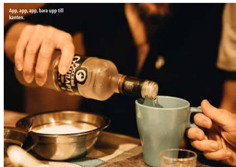
App, app, app, bara upp till kanten.