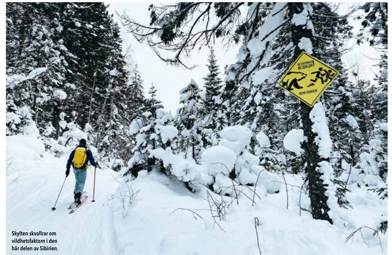
Skytten skvallrar om vildhetsfaktorn i den här delen av Sibirien.