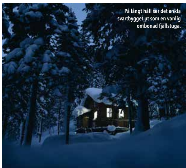
På långt håll ser det enkla svartbygget ut som en vanlig ombonad fjällstuga.