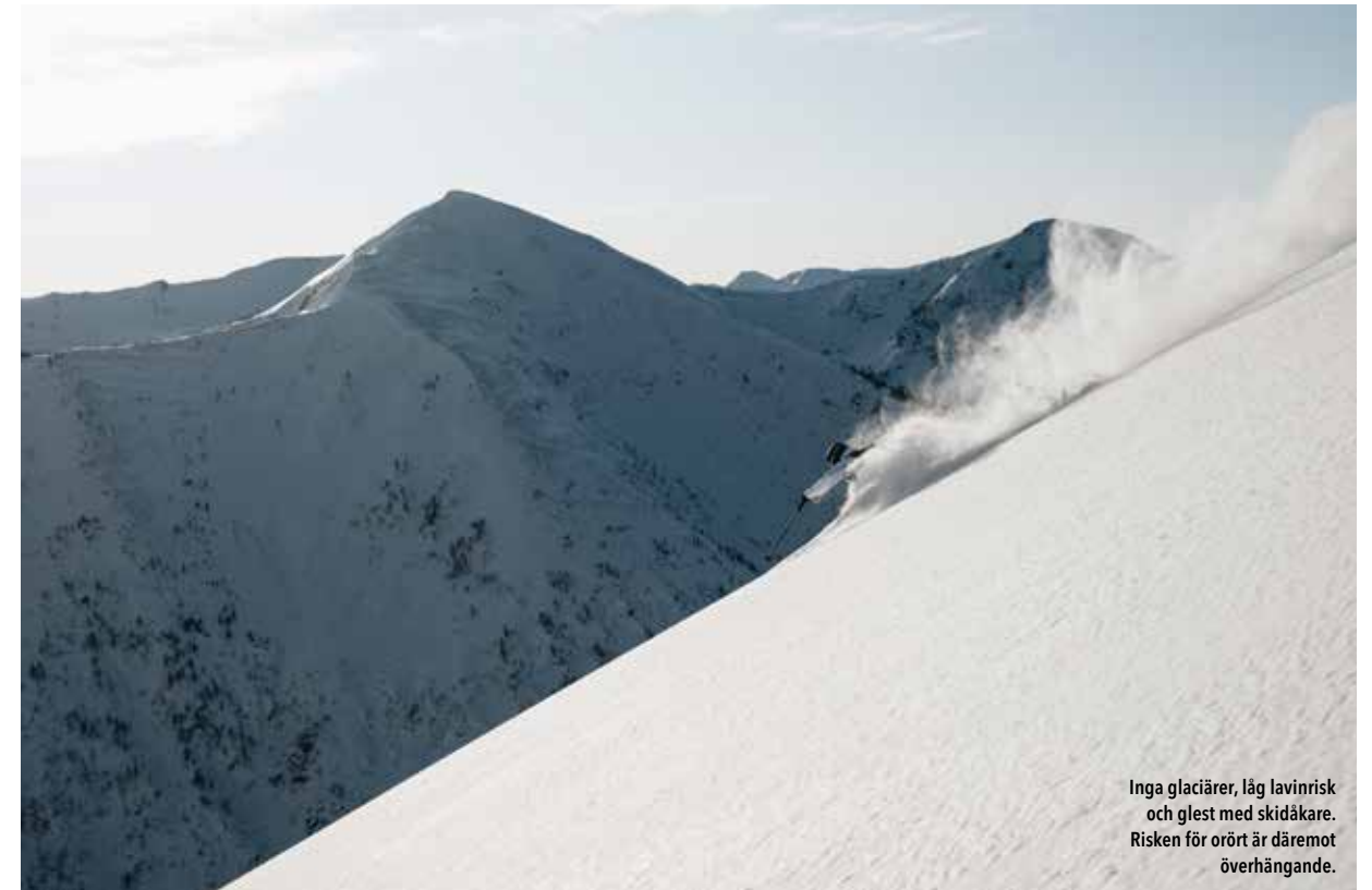
Inga glaciärer, låg lavinrisk och glest med skidåkare. Risken för orört är däremot överhängande.